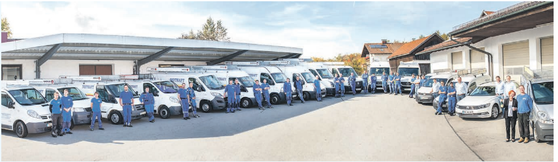
17 Fahrzeuge, 42 Mitarbeiter und 50 Jahre Heizung Lüftung Sanitär Nothaft, darauf sind Mitarbeiter und Inhaber besonders stolz. Gefeierte wird im Juni mit einem großen Wochenend-Ausflug.